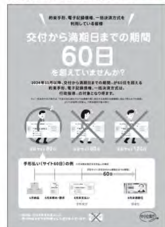
【図1】手形運用変更周知ポスター*4