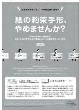
【図2】紙の約束手形、やめませんか?※5

紙の手形・小切手の利用廃止については、2021年6月18日に「成長戦略実行計画」で産業界及び金融界による自主行動計画の策定を求めることで、5年後（2026年）の約束手形の利用の廃止に向けた取組を促進する。と閣議決定されており、また、2023年6月9日に「デジタル社会の実現に向けた重点計画」において、決済については、法人インターネットバンキングの利用促進や手形・小切手の電子化に向けた取組を通じて