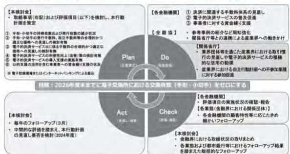
【図3】「手形・小切手機能の全面的な電子化に向けた自主行動計画」の全体像※6

紙の手形・小切手の利用廃止については、2021年6月18日に「成長戦略実行計画」で産業界及び金融界による自主行動計画の策定を求めることで、5年後（2026年）の約束手形の利用の廃止に向けた取組を促進する。と閣議決定されており、また、2023年6月9日に「デジタル社会の実現に向けた重点計画」において、決済については、法人インターネットバンキングの利用促進や手形・小切手の電子化に向けた取組を通じて